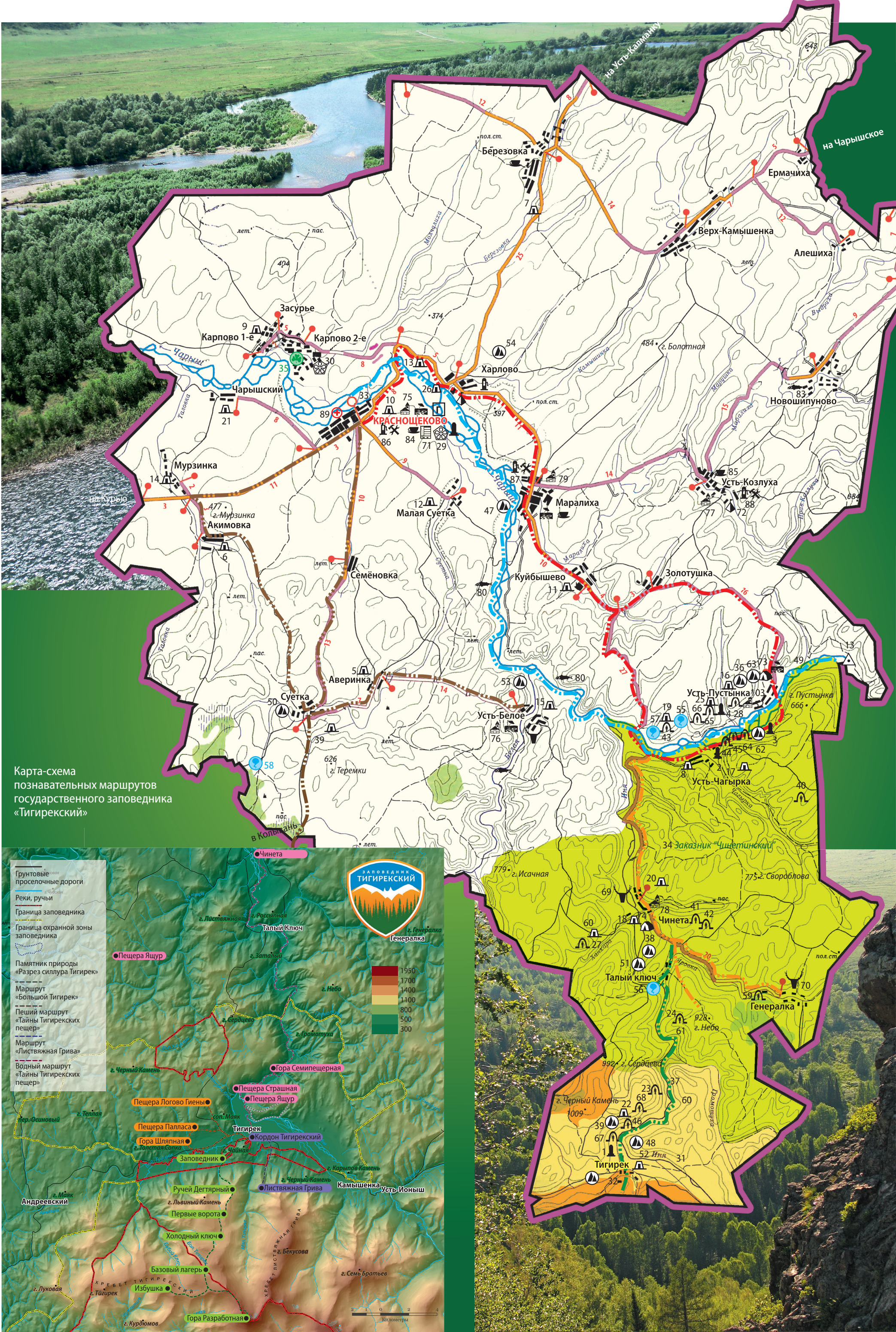
Карта-схема познавательных маршрутов государственного заповедника «Тигирекский»